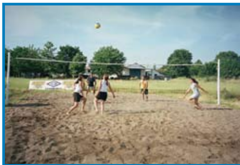
Το γήπεδο beach-volleyball στις εγκαταστάσεις του Τ.Ε.Φ.Α.Α.