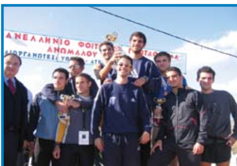
Α΄ θέση στο Παν/νιο Φοιτητικό Πρωτάθλημα Ανωμάλου Δρόμου-Κερκίνη Σερρών-2006.