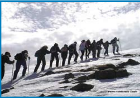
Εξάσκηση σε trekking στο Βουνό Βασιλίτσα Δεκέμβριος 2006.