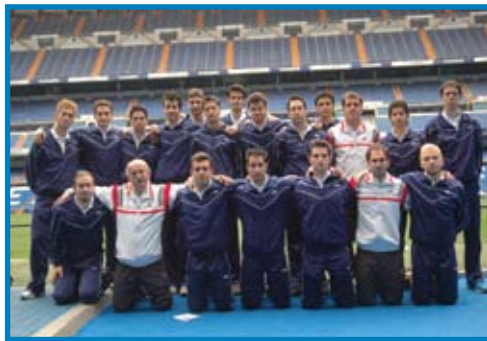
Εκπαιδευτική εκδρομή στην Ισπανία, Ρεάλ Μαδρίτης, γήπεδο Bernabeu, Μάιος 2006.