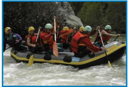
Εξάσκηση σε rafting στον ποταμό Αλιάκμονα Μάρτιος 2006