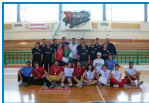
Από το επίσης εσωτερικό πρωτάθλημα καλαθοσφαίρισης 3x3 που το διοργανώνει η ειδικότητα καλαθοσφαίρισης του ΤΕΦΑΑ.