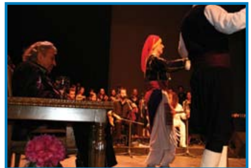
Τιμητική εκδήλωση του Παν/μιου Θεσσαλίας για την αναγόρευση του Μίκη Θεοδωράκη σε επίτιμο διδάκτορα, Βόλος-Νοέμβριος 2006.