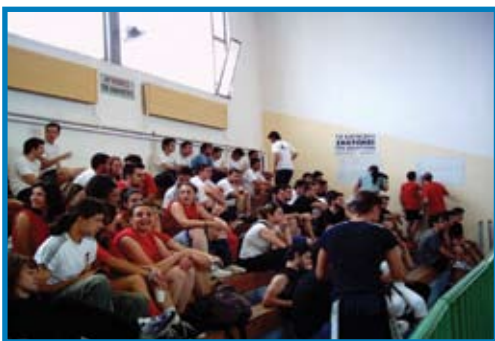
Εσωτερικό πρωτάθλημα μπάσκετ των φοιτητών.