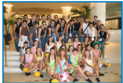
Ομάδα Α.Κ.Χ. λίγο πριν την αναχώρησή της για την τελετή έναρξης στο κλειστό γυμναστήριο Γαλατσίου, Αθήνα, Ιούνιος 2006.