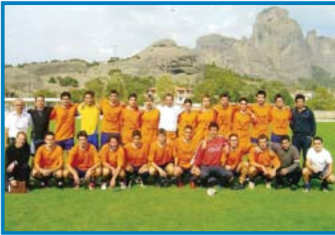
Φιλικά με ερασιτεχνικές ομάδες του Ν.Τρικάλων ΤΕΦΑΑ Τρικάλων-Μετέωρα.