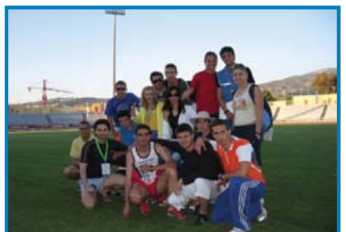
Πανεπιστημιάδα- Πάτρα 2006.