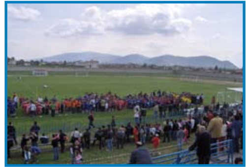
Τουρνουά Φαρκαδόνας Μάιος-2006.